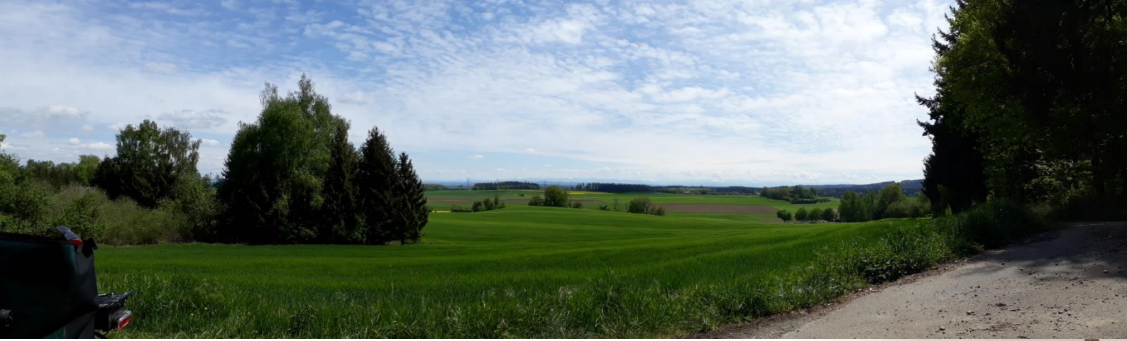
Ausblick bei Hüttenreute